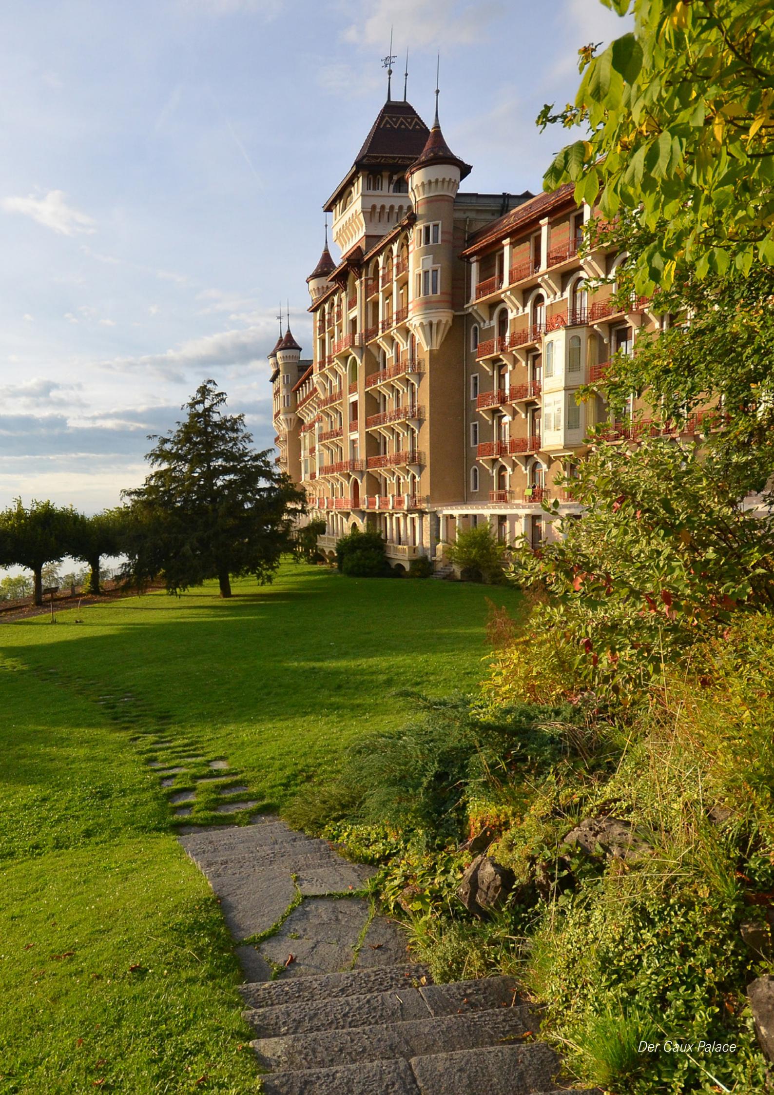
Der Caux Palace