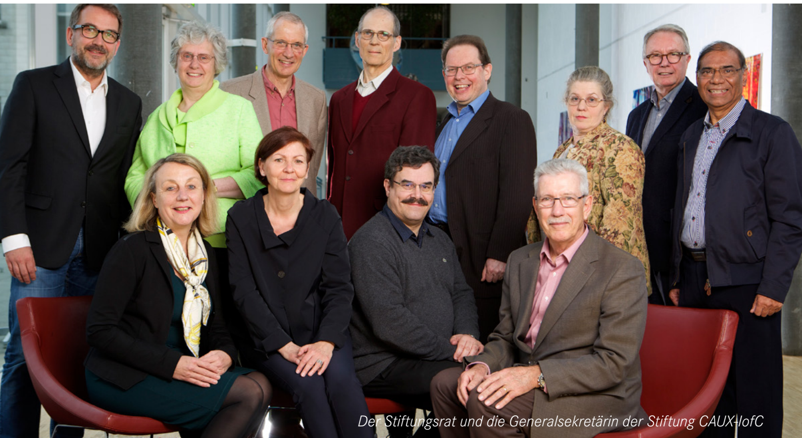
Der Stiftungsrat und die Generalsekretärin der Stiftung CAUX-IofC

D ie Stiftung hat 2015 ihre Vision und ihren Auftrag neu formuliert und eine 5-Jahres-Strategie eingeführt (2016-2020) (1).